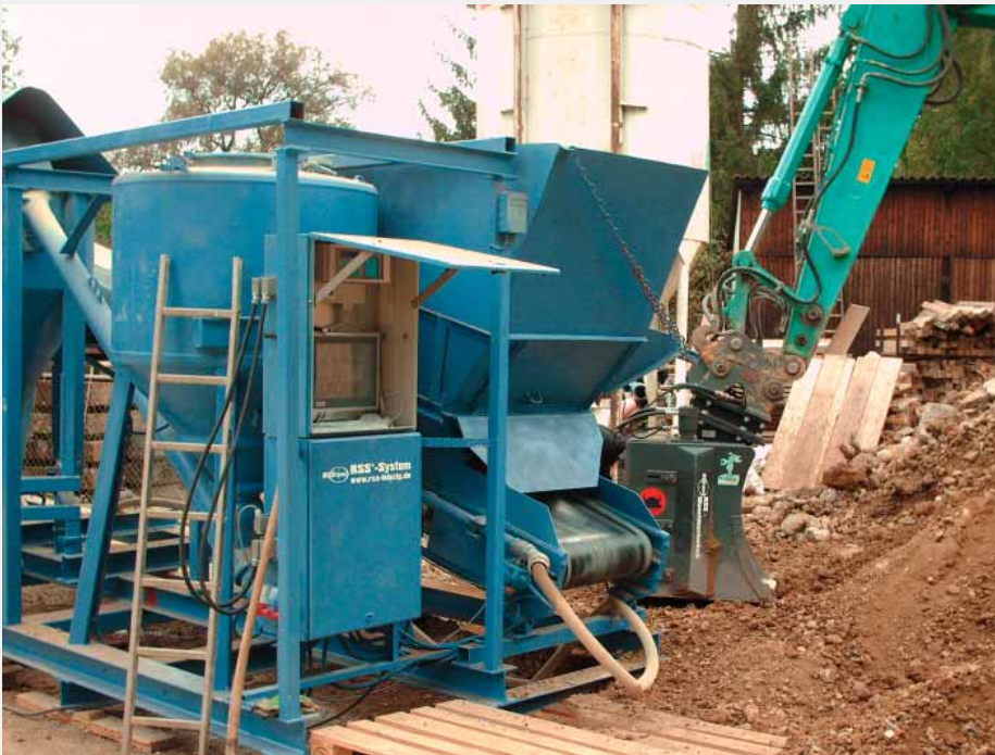
Herstellung von RSS Flüssigboden mit der RSS Kompaktanlage

dosierung in der Schaufel mittels Dosiereinheit macht auch die Verbräuche steuerbar und reduziert den Materialverbrauch durch die homogene Verteilung des Kalkes und seine beschleunigte Reaktion in der Bodenmasse der Schaufelfüllung. Diese und weitere Vorteile dieser Technik reduzieren die Kosten der Bodenaufbereitung deutlich bei verbesserter Qualität, höherem Durchsatz, schnellerer Reaktion und geringerem Verschleiß.