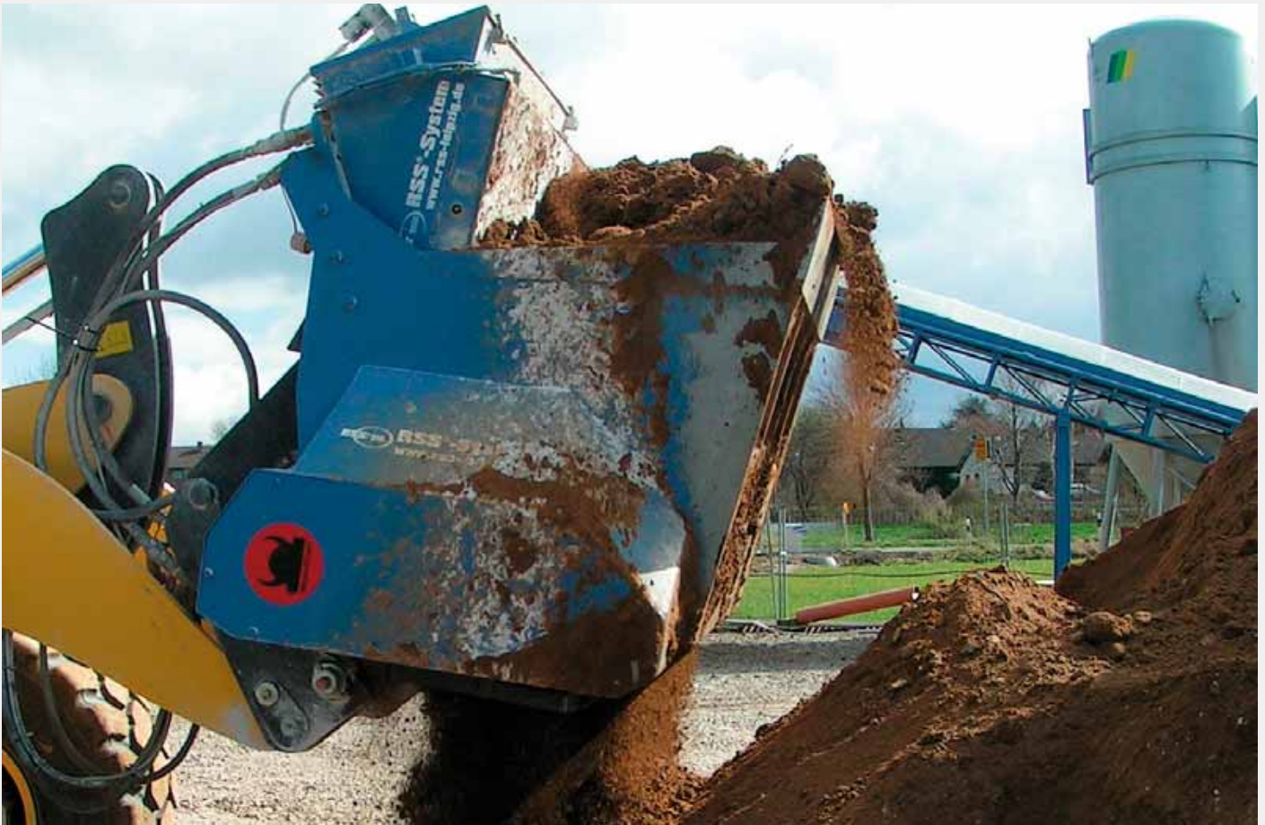
Schaufelseparator „SkanCraft“ mit Dosiereinheit

sogenannten „Kompaktanlage“ zu Flüssigboden verarbeitet. Anschließend wird das Material beispielsweise mittels Fahrmischer zur Baustelle gebracht und mit Hilfe geeigneter Anbauteile am Bestimmungsort eingebaut. Dabei erfolgt die Lagesicherung von unterirdischen Bauwerken oder Rohrleitungen auch wieder mittels speziell entwickelter technischer Hilfsmittel, den sogenannten „Rohrverlegethilfen“. Diese ermöglichen es ebenfalls, über die Messung des Auftriebs und damit des vorher auf die Baustellenanforderungen angepassten Materialverhaltens, die korrekte Lagesicherung der Rohre durchzuführen, den Aufwand zur Lagesicherung zu minimieren und diese Technik zusätzlich über die einfach durchführbaren Messungen als Instrument der Qualitätssicherung und des Qualitätsnachweises zu nutzen.