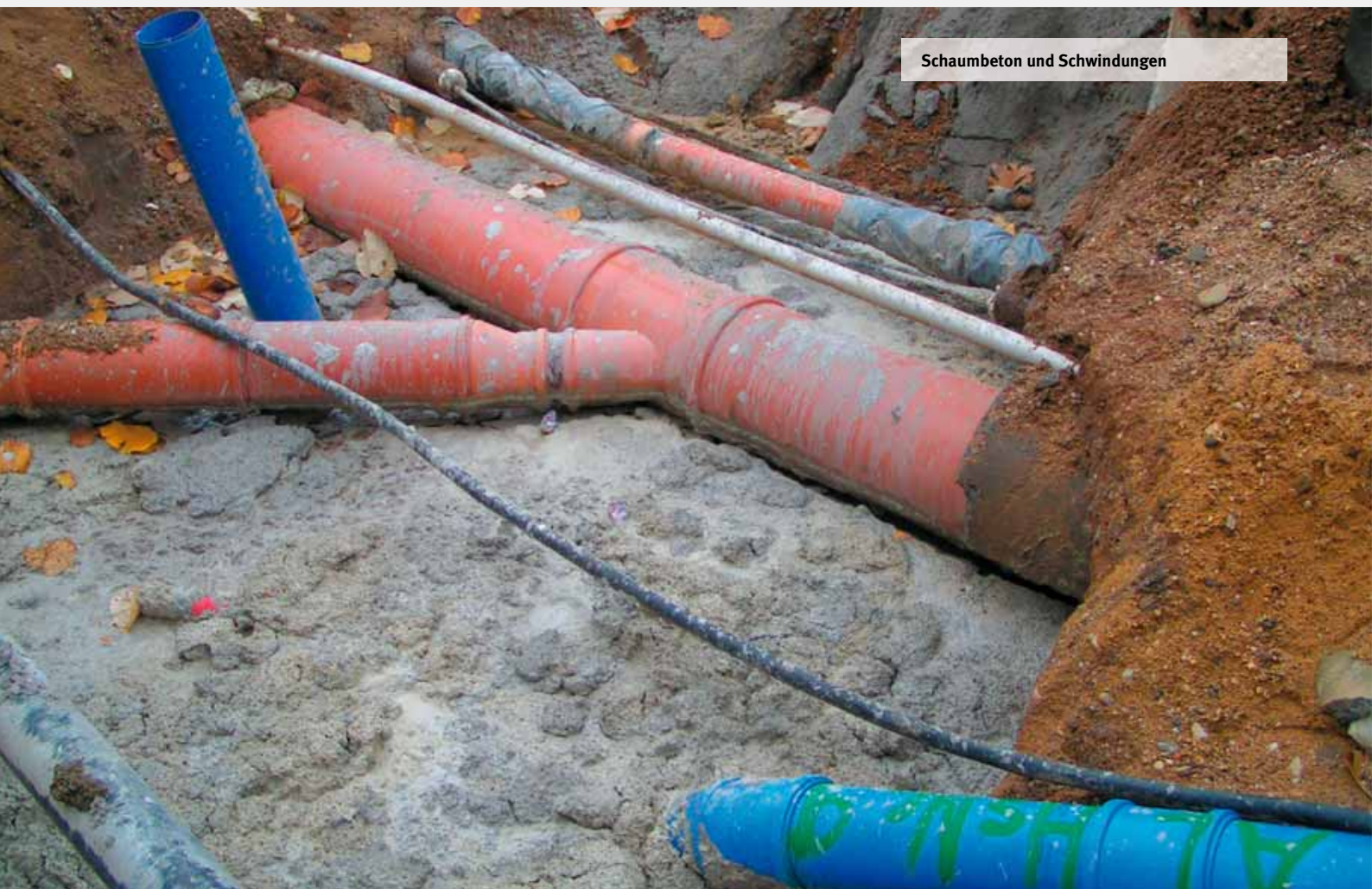
Schaumbeton und Schwindungen

Hilfe jede Art von Aushub zeitweise in fließfähigen Zustand versetzt werden kann und kontrolliert wieder so fixiert, dass die bautechnisch wichtigen Eigenschaften des Ausgangsbodens weitgehend erhalten werden. Die Aufbereitung zu Flüssigboden kann dabei in zentralen Anlagen oder mit kompakten Anlagen