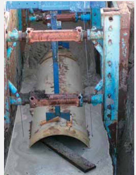
Flüssigboden verdrängt Wasser

Wird der Begriff Flüssigboden richtig verwendet, beschreibt er ein Verfahren, mit dessen