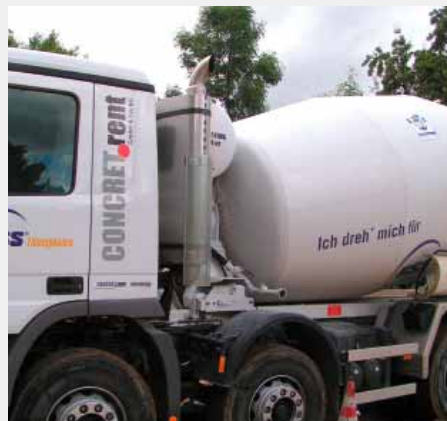
Mischer für Flüssigboden

der Praktiker und der direkt betroffenen Anwender und Auftraggeber entscheidend mitbestimmt. So ist es heute bei Nutzung dieser Voraussetzungen leicht möglich, sich vor ungewollten Überraschungen und Nebenwirkungen zu schützen, die bei falscher Nutzung des Begriffes „Flüssigboden“ erfahrungsgemäß oft mit gravierenden Folgen eintreten.